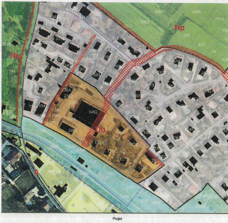
Figure 1 : Projet de modification du PLU pour le secteur gare

Le projet d'évolution de la mobilité à l'intérieur du périmètre de l'OAP est présenté comme nécessaire pour permettre la densification du secteur gare, en ayant un impact positif sur les déplacements à l'intérieur et à l'extérieur de l'OAP. Cela inclue la décision de créer un emplacement réservé pour une nouvelle voie à sens unique sur les parcelles 1080, 1079, 2364, 1543, 1545, 2481 (voir Figure 1).