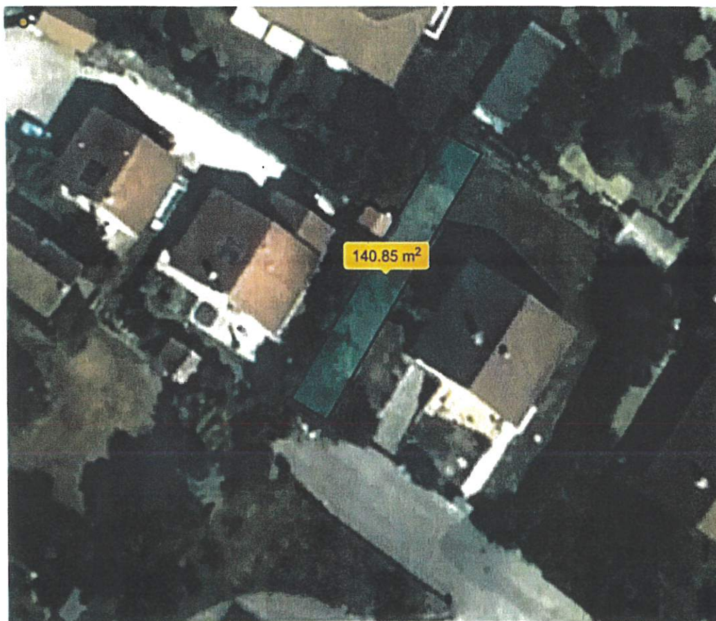
Figure 3 : Emplacement réservé sur la parcelle 1079

La parcelle 1079, dans laquelle la création d'un emplacement réservé est prévue, perdrait donc une surface de 31,28 \times 4,5 \sim 140,8 \text{ m}^2 (voir Figure 3) dans laquelle aucune nouvelle construction ne pourrait être envisagée. Cette situation entrainerait de fait une dévaluation de la valeur foncière du terrain induisant une perte financière conséquente.