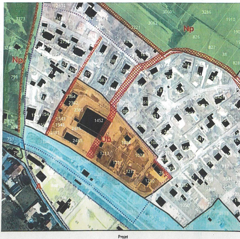
Figure 2 : Projet de modification du PLU pour le secteur gare

En ce qui nous concerne, le problème est encore aggravé par la décision de créer un emplacement réservé pour une nouvelle voie à sens unique sur les parcelles 1080, 1079, 2364, 1543, 1545, 2481 (voir Figure 2).