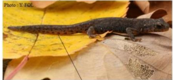
Taches rondes et noires sous la queue