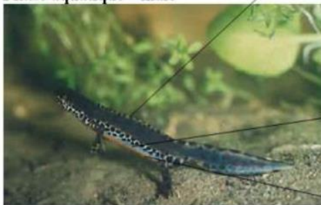
Petite crête blanche barrée de noir