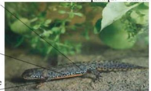
Phase aquatique - femelle