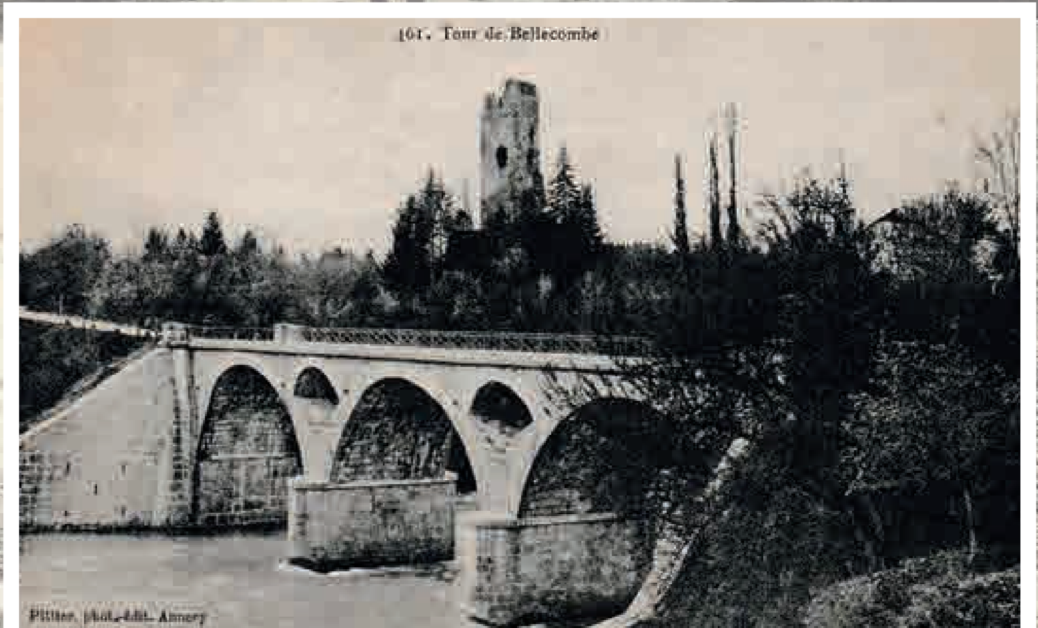
161. - Tour de Bellecombe