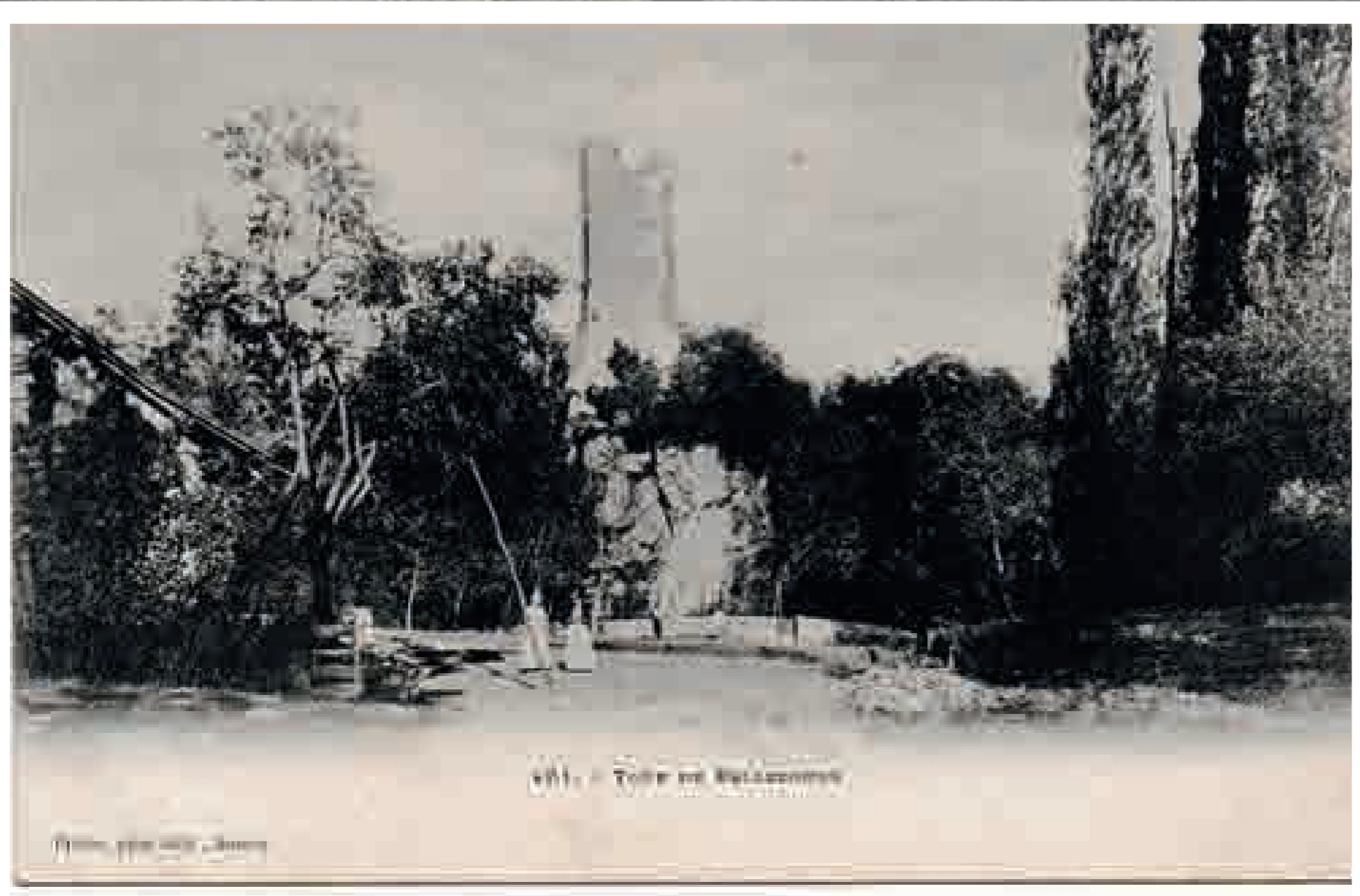
141. - Tour de Bellecombe