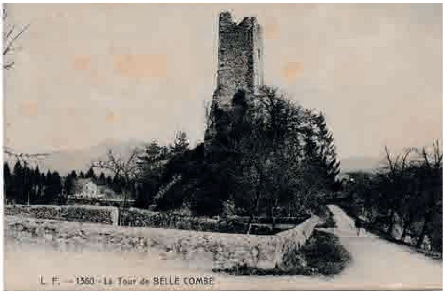
L. F. - 1360 - La Tour de BELLE COMBE